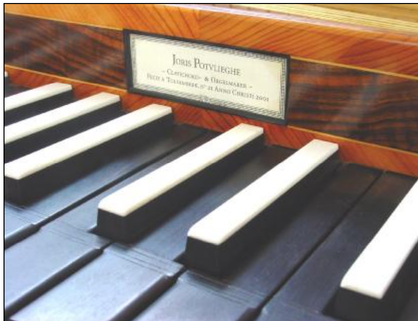
DETAIL SAKSISCH CLAVICHORD 1770 IN NOTENHOUT, ONTWERP JORIS POTVLIEGHE.

In het atelier wordt gewerkt met een bouwcyclus van vier klavichorden die simultaan worden gebouwd tot de fase waarin zich uitvoeringsvarianten kunnen voordoen. Door een optie te nemen wordt een klavichord binnen de cyclus gereserveerd en is de leveringstermijn afhankelijk van het reservatiemoment in relatie tot de vorderingen binnen de cyclus.