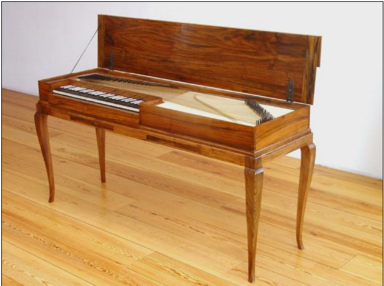
CLAVICHORD GEBOUWD NAAR PH.J.SPECKEN DOOR JORIS POTVLIEGHE IN 2003, N° 23. COLLECTIE JOS VAN IMMERSEEL.